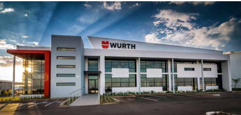
Wuerth South Africa (Pty.) Ltd. in Gauteng, Zuid-Afrika

Met name bij het verzamelen en verwerken van persoonlijke gegevens gaan we voorzichtig te werk. We houden ons aan de geldende wetten inzake gegevensbescherming en benoemen bevoegde instanties die verantwoordelijk zijn voor het naleven hiervan.