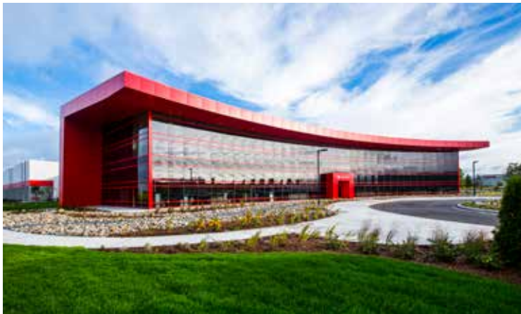
Würth Canada Ltd., Ltée in Guelph, Kanada

Dit geldt niet voor incidentele schrijfactiviteiten, lezingen en soortgelijke activiteiten die geen invloed hebben op de legitieme belangen van de werkgever. We zijn blij met de vrijwillige inzet van onze werknemers.