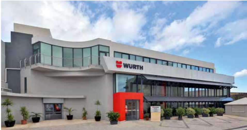
Würth Limited in Zebbug, Malta

We zijn ons ervan bewust dat de genoemde beperkingen niet alleen fysiek voorhanden waren betreffen, maar ook informatie en technologieën. Ook deze mogen niet ongeoorloofd worden doorgegeven. Overtredingen hiervan kunnen enorme schade voor de Würth-groep veroorzaken. Alle werknemers worden derhalve opgeroepen, behoedzaam te handelen en bijv. informatie niet ongeoorloofd per e-mail of telefoon door te geven. Onze medewerkers kunnen en moeten zich met vragen en onzekerheden altijd wenden tot de leidinggevende of de bevoegde instantie binnen de onderneming.